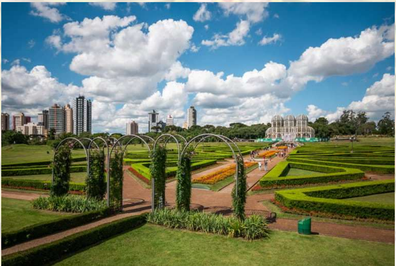
Jardim Botânico – Curitiba – PR