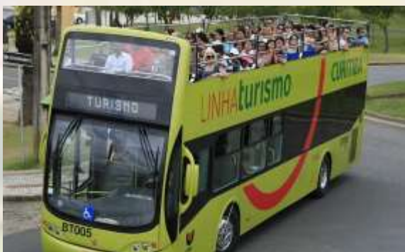
Linha de Turismo – Ônibus Panorâmico de Curitiba