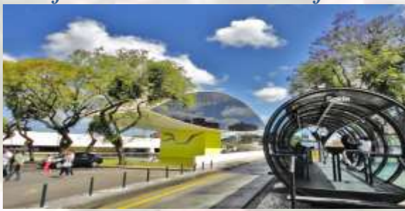
Museu do Olho