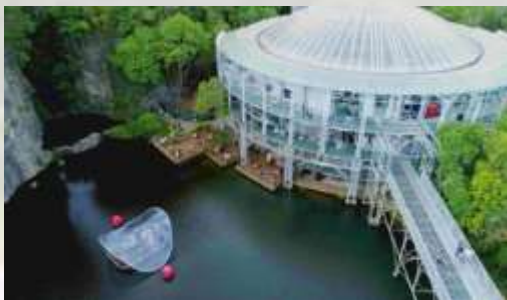
Opera de Arame – Curitiba – PR